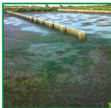
Иловые карты с осадком влажностью 95-98%

The use of our fermentic-cavitational technology makes it possible to process both newly-formed and accumulated (deposited) sludge at any urban wastewater treatment plants.