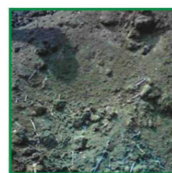
Иловый осадок сточных вод влажностью 55-60%, обезвоженный на иловых картах