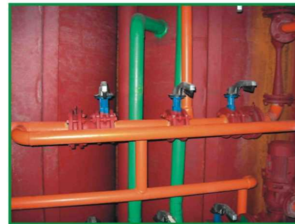
Компактное машинное отделение – встраивается под емкостями