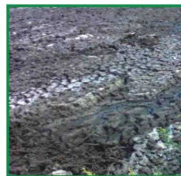
Иловая карта с осадком влажностью 80-85%