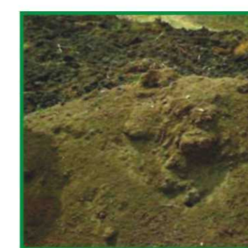
Складирование обезвоженного илового осадка 40-50% влажности в буртах, для дальнейшей погрузки и транспортировки на поля

40-50% wet sludge – end product (biosolids) – kept in storage for further transportation to the fields