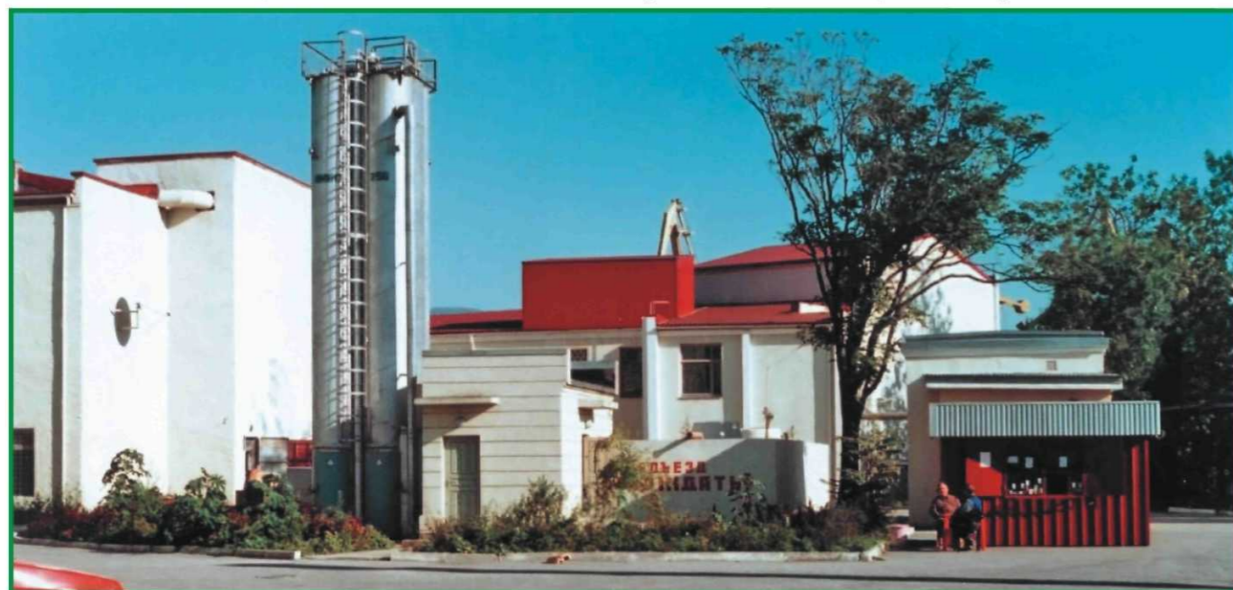
Treatment station 250 m3/day in residential area (without insulation)

Установка производительностью 250 м3/сутки в жилой застройке без утепления.