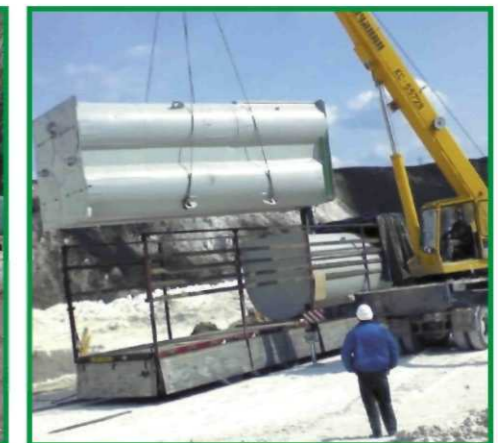
транспортировка до места установки